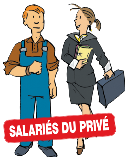
SALARIÉS DU PRIVÉ

Trouvez-vous normal que le système de retraites soit divisé en castes ? Trouvez-vous normal qu'autant de différences persistent malgré les réformes ?